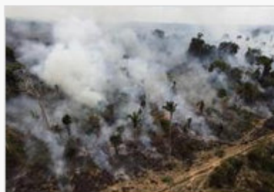
Tempo seco favorece as queimadas

Segundo dados do INPE (Instituto Nacional de Pesquisas Espaciais), desde o primeiro dia do ano até hoje, o Brasil já registrou quase 4500 grandes focos de queimadas, 75% a mais que no mesmo período do ano passado. Na Bahia, por exemplo, foram quase 480 focos contra pouco menos de 300 focos no ano passado, aumento de pouco mais de 60% de um ano para outro.