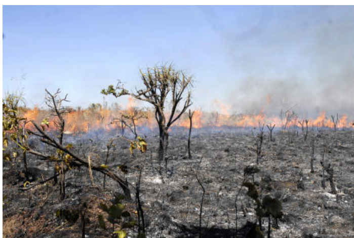
Queimada no Cerrado.

O Ministério do Meio Ambiente (MMA) entrou em estado de alerta por causa do período de queimadas, que começou neste mês e que se intensificará em agosto e setembro. Somente no dia 13/7 foram detectados 119 focos de incêndio no país, a maior parte no estado de Mato Grosso (35 focos).