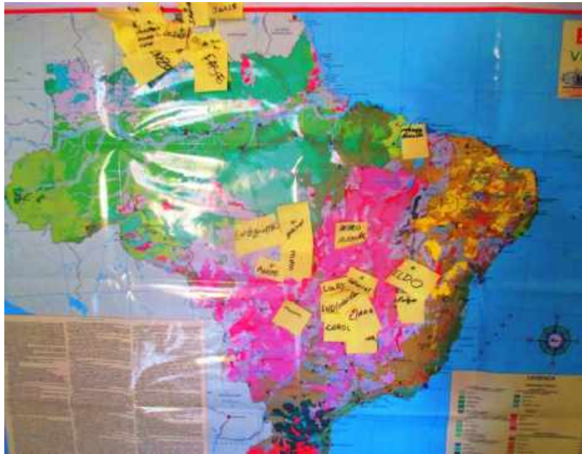
Figura 1: mapa produzido durante as apresentações dos participantes

O tema 1 foi discutido em grupo no sábado 11/03 à tarde e apresentado na segunda feira 13/03, com o auxílio de desenhos. Os participantes foram divididos em 3 grupos regionais: Amazônia, Transição Amazônia Cerrado, e Cerrado Central (cf figura 2).