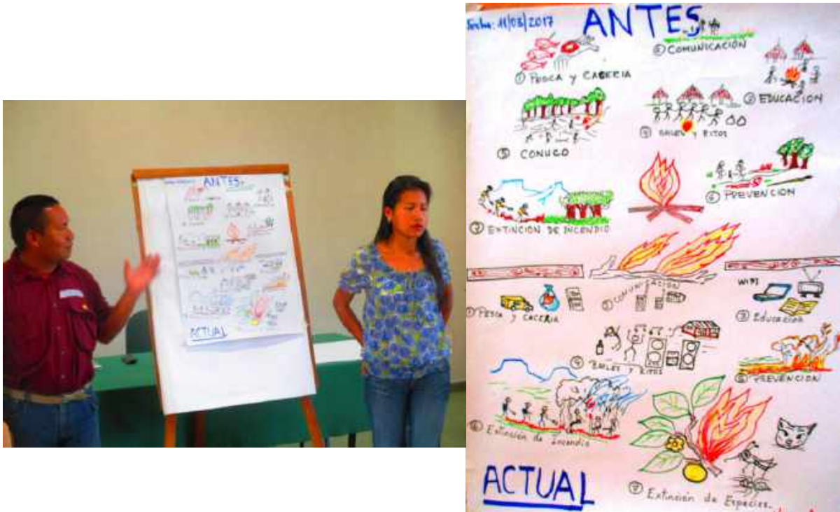
Figura 3: Apresentação dos representantes da comunidade indígena Pemón de Kavanayén (Ve)

Este grupo encontra-se nas regiões de savanas amazônicas, onde, apesar do fogo ser parte integrante do funcionamento destes ecossistemas, seu uso tradicional é muitas vezes mal compreendido pelos atores governamentais e pesquisadores. Nestes ambientes, a vegetação adaptada ao fogo (campos e savanas) coexiste com a vegetação sensível ao fogo (áreas úmidas, matas de galeria), o que torna os incêndios muito danosos.