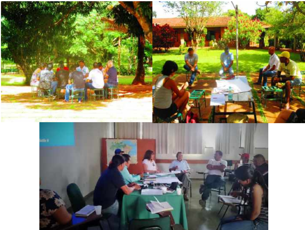
Figura 2: trabalho em grupos: grupo "Transição Amazônia-Cerrado" à esquerda, grupo "Cerrado" à direita, e grupo "Amazônia" embaixo.