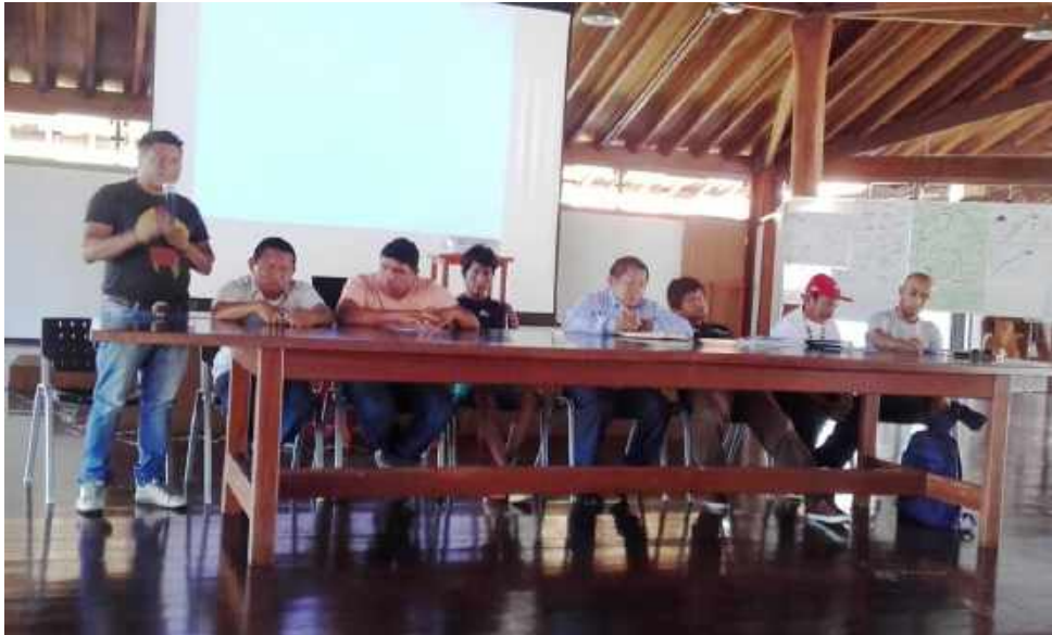
Figura 8: mesa de abertura do seminário aberto (16/03/17)

A maioria dos participantes indígenas afirmaram a importância do fogo na sua cultura, do problema dos incêndios e dos conhecimentos tradicionais para o manejo do fogo. Falaram que gostaram de participar do evento, para trocar conhecimento e experiência, e de conhecer técnicas modernas para acender (pinga-fogo) e apagar (soprador) fogo, na saída de campo. Compararam com palhas de palmeira seca e comentaram como o pinga fogo seria mais eficiente para fazer contra fogos e acabar com incêndios grandes nos seus territórios.