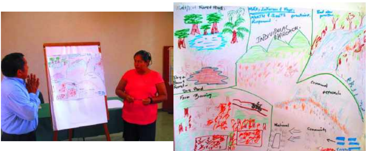
Figura 4: Apresentação dos representantes da comunidade da região de Rupununi (Guiana)

Bibiana Bilbao (Universidade Simón Bolívar, Ve) explicou o sistema de uso do fogo pelos Pemón Arekuna e Taurepán e outros povos indígenas da Gran Sabana na Venezuela. O governo estabeleceu um processo de exclusão do fogo, o que aumentou os conflitos. As experiências a longo prazo de ecologia do fogo começaram em 1998 e evidenciaram a base científica do manejo indígena do fogo, mostrando sua eficácia na prevenção de incêndios, através de mosaicos de queima nas zonas de transição entre a savana e a floresta. Agora a política do INPARQUE está começando a mudar por conta da interação entre conhecimento tradicional-científico e instituições.