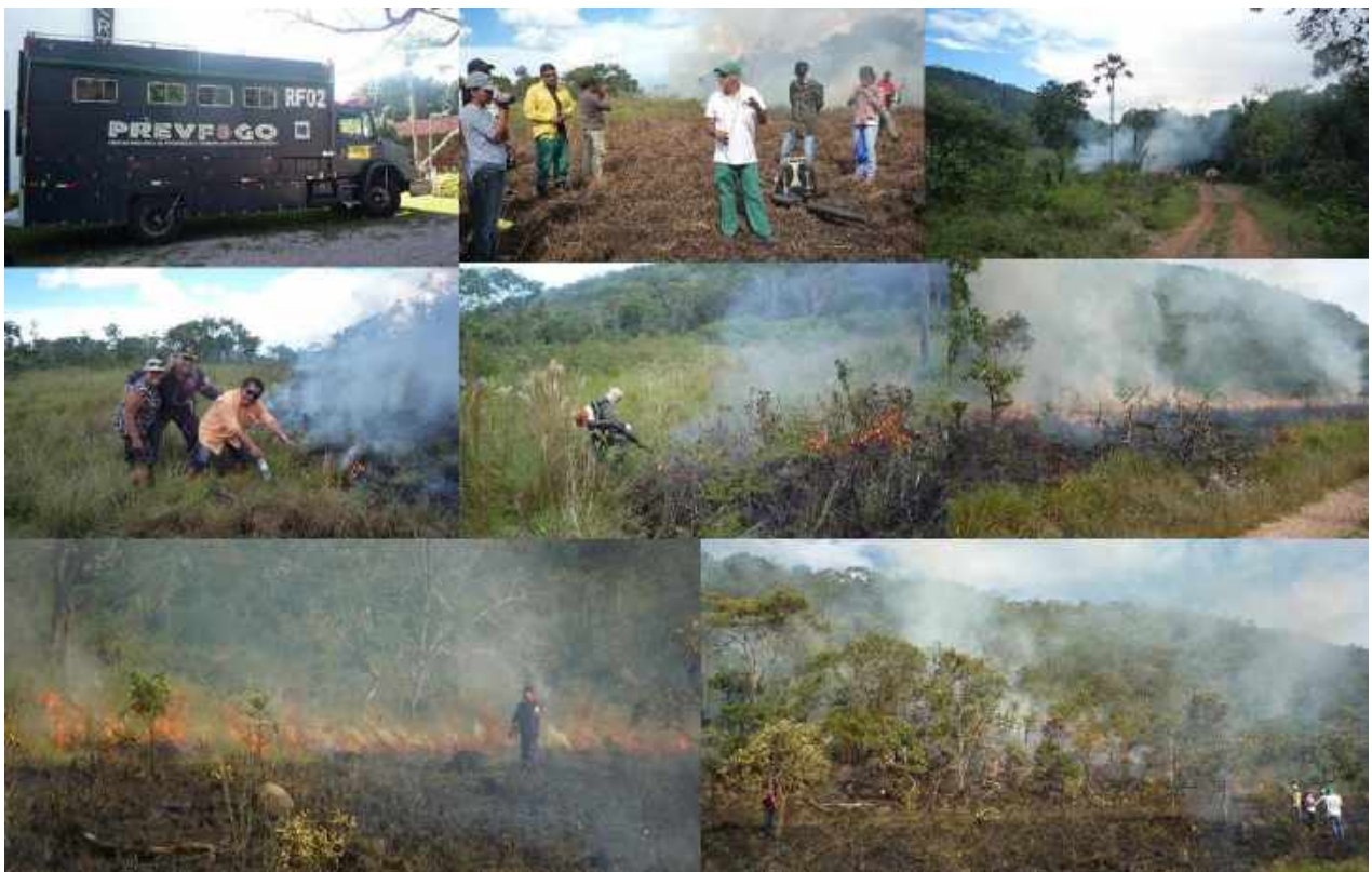
Figura 9: realização das queimadas prescritas na saída de campo