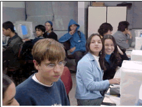
(a) Alunos no Laboratório de Informática da Escola, usando o GEODEM.