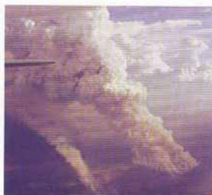
Nuvens pirocumulus se formam próximas a grandes incêndios

Além da fumaça, as queimadas geram outros fenômenos que influem na aviação, como as nuvens pirocumulus. Um grande incêndio produz fortes correntes ascendentes de ar, e a vegetação libera uma grande quantidade de vapor d'água para a atmosfera durante a combustão. A base dessas nuvens é de difícil identificação, pois muitas vezes está escondida atrás da fumaça do incêndio. Os pirocumulus possuem dimensão vertical variável, podendo variar de pequenos cumulus até cumulus congestus (TCU), que costumam produzir pancadas de chuva que ajudam a extinguir o fogo; ou então se desenvolvem como um cumulonimbus (CB). Os pirocumulus devem ser evitados durante os vôos, pois reduzem a visibilidade e aumentam a turbulência. Além disso, as cinzas afetam o desempenho das aeronaves turboélice e a jato devido a uma perigosa mistura de água e cinzas. O registro de fumaça em aeroportos pode ser identificado nas mensagens METAR dos aeródromos, mas somente quando a visibilidade é menor ou igual a 5 000 metros; o código é o conhecido "FU". Outra maneira de se identificar as regiões onde há queimadas é através de imagens de satélites. Também é preciso lembrar da presença de fumaça nas operações militares, pois ela prejudica o reconheci-