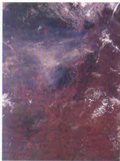
Duas fotos de satélite mostram uma triste realidade: focos de incêndio na fronteira entre Brasil, Bolívia e Paraguai (esq.); e a fumaça encobrindo o Estado do Pará

As queimadas são, em sua maioria quase absoluta, provocadas por fazendeiros com a intenção de renovar pastagens, preparar a colheita da cana-de-açúcar, desmatar novas áreas, ou mesmo para limpar a vegetação de uma região. A curto prazo, as queimadas fertilizam a camada superficial do terreno mas, a médio e longo prazo, causam males